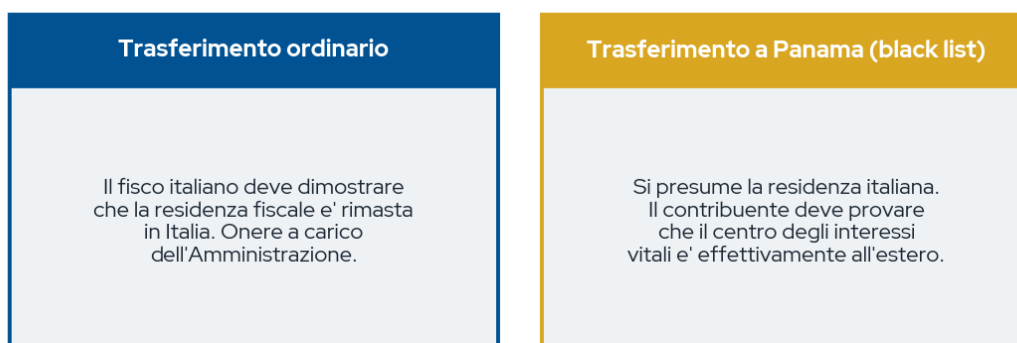
Figura 2. Per un trasferimento a Panama la presunzione legale ribalta sul contribuente l'onere di dimostrare l'effettivita' della residenza estera.